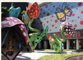
草間彌生<幻の華>2002年

☎0263-39-7400 時 9:00-17:00(入場は16:30まで) 休 月曜(祝日の場合は翌日)、年末年始 ¥ 一般410円、高大生200円、中学生以下無料 (企画展「不思議の国のアリス展」は別料金)