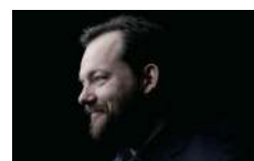
アンドリス・ネルソンス

Saito Kinen Orchestra Conductor: Andris Nelsons