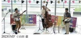
2023OMF ©山田 毅

「ようこそ楽都・松本へ!」そんな想いを込めた地元ゆかりのミュージシャンによる歓迎演奏会です。幅広いジャンルの音楽との出会いをお楽しみください。