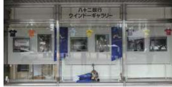
2023OMF ©山田 毅