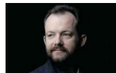
アンドリス・ネルソンス

Saito Kinen Orchestra Conductor: Andris Nelsons