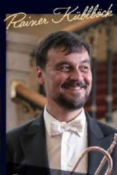
Trumpet ライナー・キューブルベック