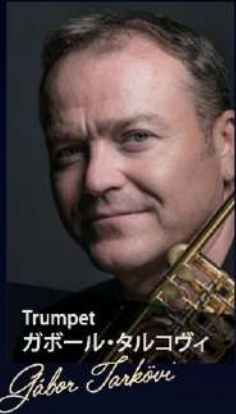
Trumpet ガボル・タルコヴィ